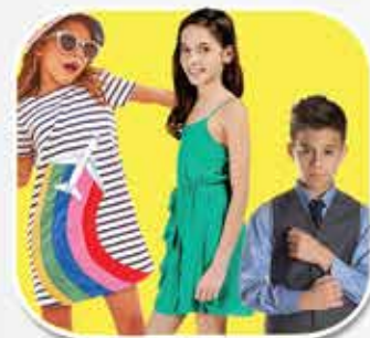
Sector Ropa ESPECIAL NIÑOS

Parqueo Ic Norte Hipódromo Av. Melchor Perez y D'orbigni