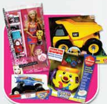
Ofertas y descuentos en el Sector Juguetes

Te esperamos este Sábado 14 de abril con SORPRESAS Y MUCHA DIVERSIÓN