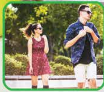
Temporada Verano Sector Ropa