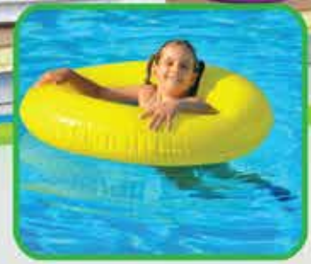
Piscinas, salvavidas Disfruta el verano al máximo