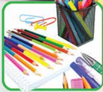
Todo el material escolar que buscas